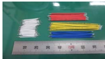
細線両端半田加工