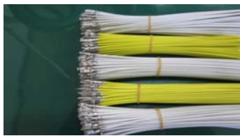
給湯器用電線加工 (シリコン絶縁ガラス編組線使用)