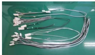
電気器具用ハーネス