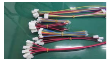
産業機器用ハーネス