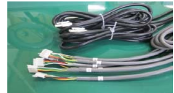
産業機器用ケーブル

お客様のニーズに応える為、簡素で無駄のない生産を致します。 又、より迅速に、より確実に、より丁寧に生産を致します。